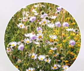
Frühsommer im 2. Standjahr