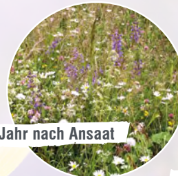
im 3. Jahr nach Ansaat