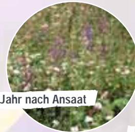
im 3. Jahr nach Ansaat