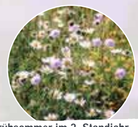
Frühsummer im 2. Standjahr